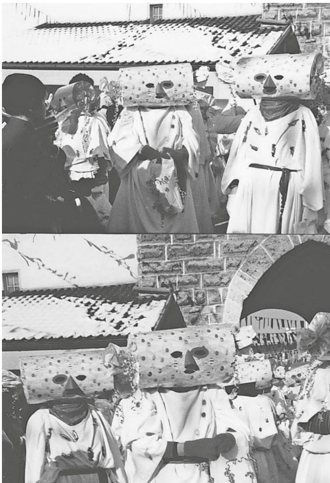
Umzugsgruppe 1985 als "Bonbons"