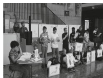
kreativ und zukunfts-fähig