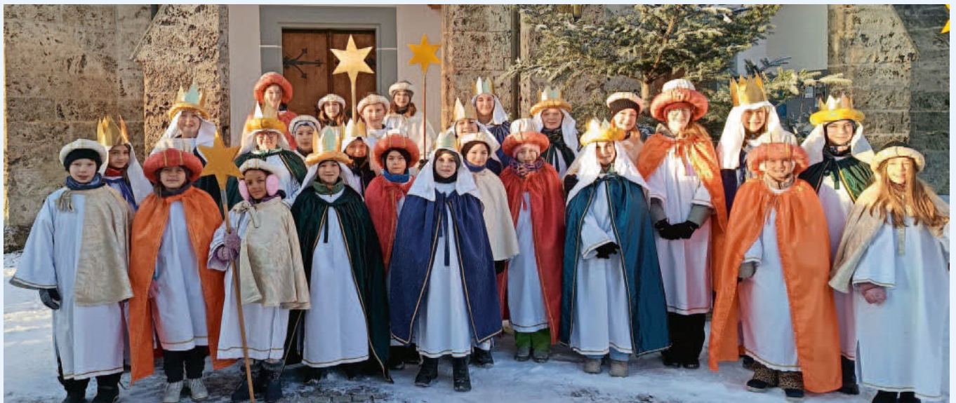
die Sternsinger aus Stetten