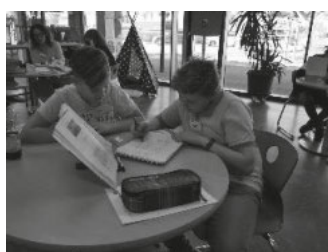
individuell und kompetent