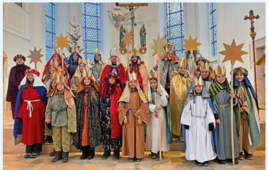
die Sternsinger aus Mühlheim

Ein herzliches Dankeschön gilt den großzügigen Spendern, den Organisationsteams in Mühlheim und Stetten für die umsichtige Vorbereitung und Begleitung der Kinder, aber allem voran den mitwirkenden Kindern für ihren großen Einsatz, den sie zum Wohle von notleidenden Kindern gezeigt haben. Die Kinder haben nicht nur den Segen, sondern auch Licht, Mitmenschlichkeit und Fröhlichkeit in die vielen Häuser getragen, die sie besucht haben.