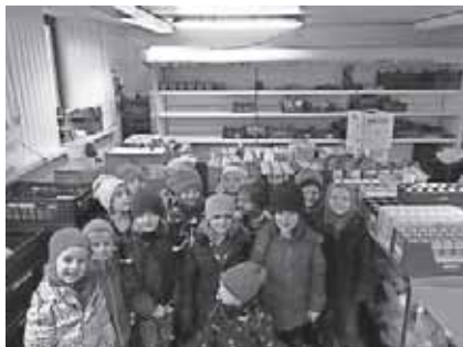
Auf dem Bild sind die zukünftigen Vorschüler zu sehen. Im Hintergrund unsere Sachspenden vom Martinsfest.