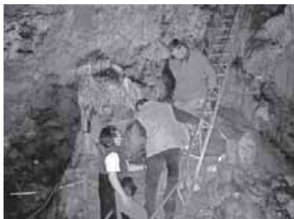
Über eine Leiter zur hinteren Höhle