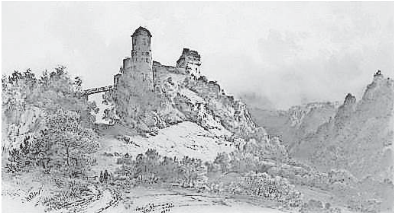
Schloss Bronnen, Pieter Francis Peters 1851

Die Ausstellungseröffnung findet am Donnerstag, 27. April um 19 Uhr im Barocksaal des Vorderen Schlosses in Mühlheim statt.