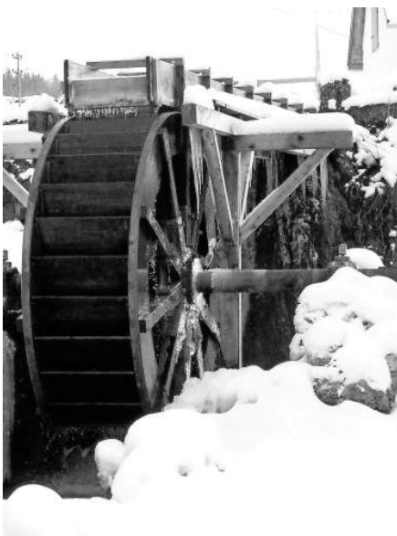
Der Winter kommt zurück

Wanderbericht - 1. Wanderung im Jahr 2012 - Mit winterlichen Voraussetzungen - Kalt - Glatte Wege - vereister Boden - so starteten 12 Albvereinler zum Einlaufen 2012. Schon die ersten Gehversuche zeigten, dass man sehr aufmerksam bei dieser Wande-